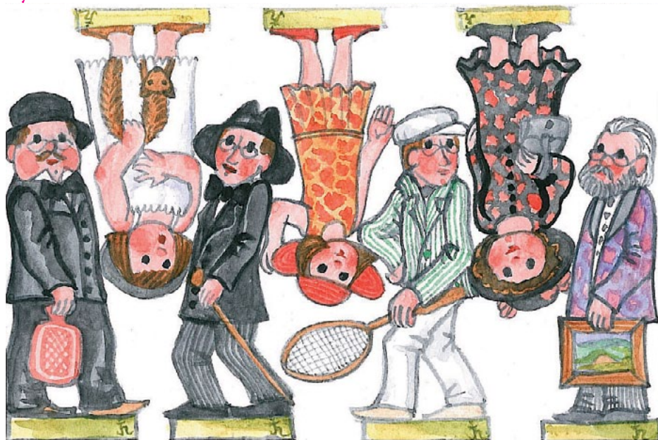
zadní strana obálky