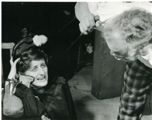
Barokní jubileum ??????