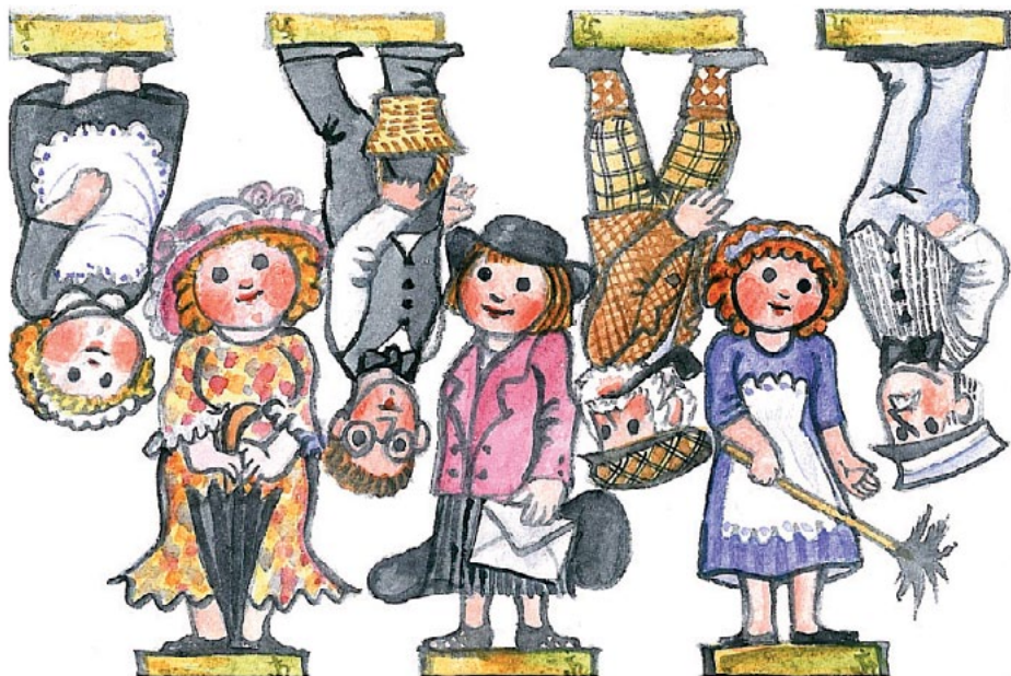
Osoby a obsazení - Ten kdo utře nos / Sedloňovský divadelní spolek MAX Vystřihovánka